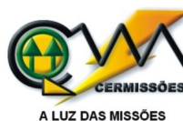
CERMISSÕES – Caibaté –